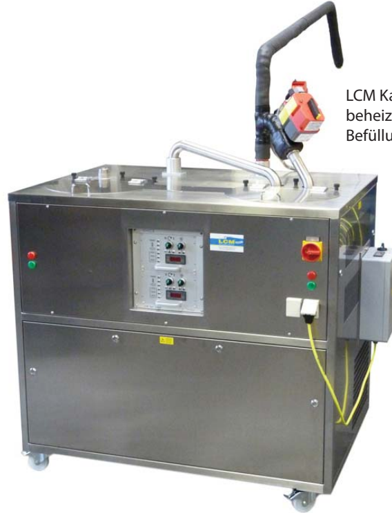
LCM Kaskaden TWIN Temper mit beheiztem Rohrsystem zur automatischen Befüllung von externen Dosieranlagen

Eine automatische Befüllung mit flüssiger Schokolade über LCM Auflöser (LCM M-Modelle) oder auch Auflöser anderer Fabrikate ist möglich.