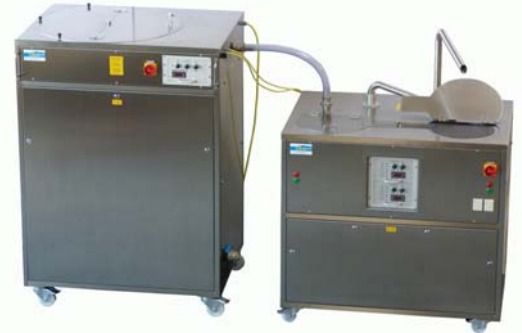
Vollautomatische Befüllung eines LCM Kaskaden TWIN Tempers über einen LCM 600 M Auflöser mit integrierter Pumpe