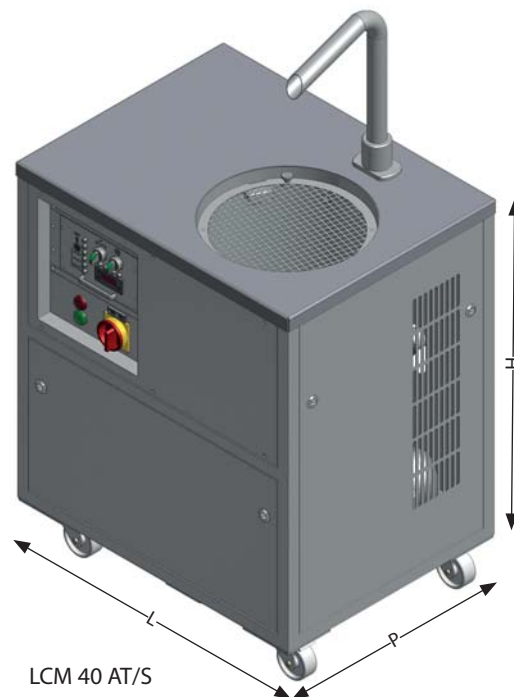
LCM 40 AT/S