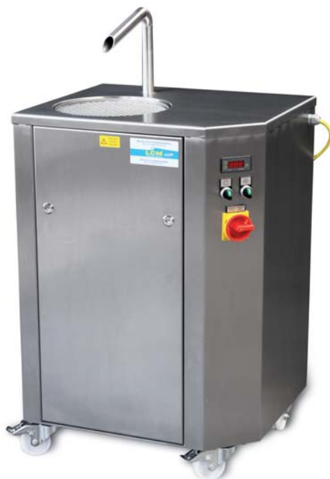
LCM 25 AT/S

L'utilisation, le changement de chocolat et le nettoyage sont très simples sur ces modèles.