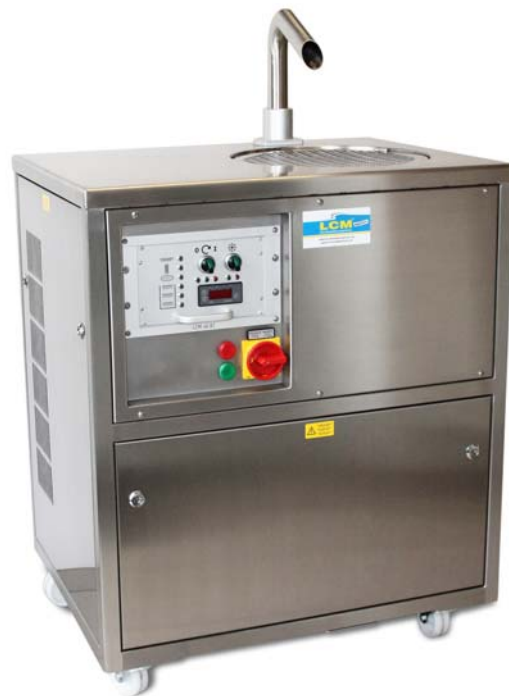
LCM 40 AT/S