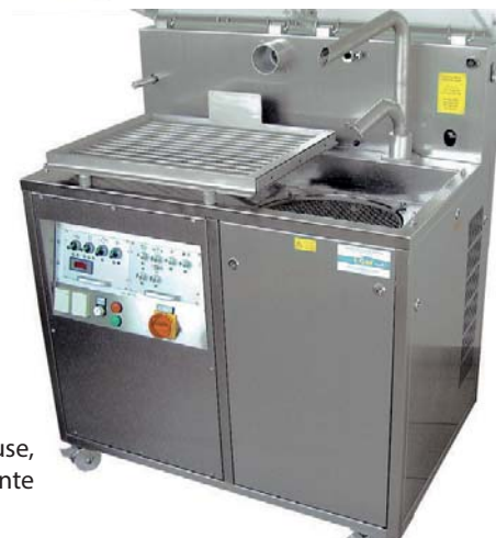
comme mouleuse, ici avec table vibrante chauffante