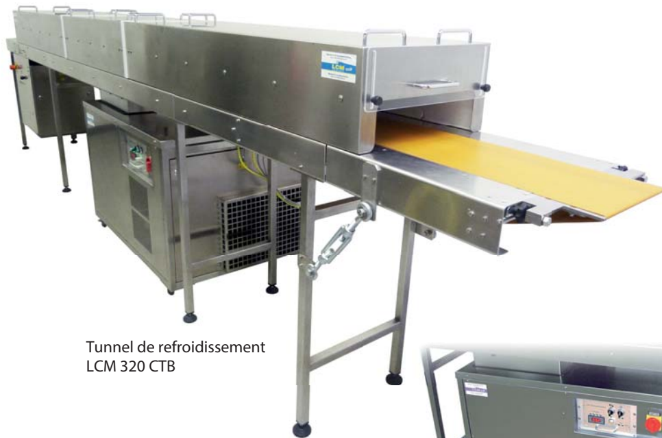
Tunnel de refroidissement LCM 320 CTB

Pour des raisons techniques, le système de refroidissement et l'unité de commande électronique interchangeable se trouvent dans une station de refroidissement séparée.