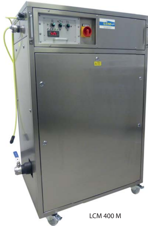
LCM 400 M

La pompe à régulation électronique fonctionne indépendamment de l'agitateur et n'est utilisée qu'en cas de besoin.