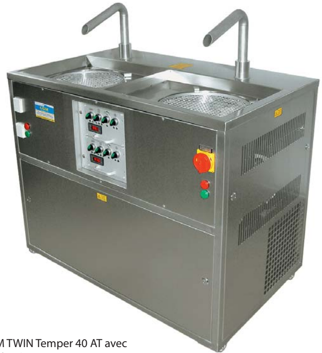
LCM TWIN Temper 40 AT avec 2 x fondoirs LCM 400 M