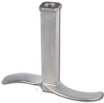
FÜR UM 44 UND UM 60 BEST.-NR.: 3D4038-02

der Baureihen UM 24, UM 44 und UM 60 in allen Ausführungen